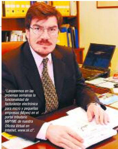
“Lanzaremos en las próximas semanas la funcionalidad de facturación electrónica para micro y pequeñas empresas (Mipies) en el portal tributario MIPYME de nuestra Oficina Virtual en Internet, www.sii.cl ”.

—Justamente este segmento es uno a los que apuntará la funcionalidad de facturación electrónica en el portal MIPYME del SII. Entendiendo que estas empresas emiten un número de facturas muy reducido, el costo de la opción manual o papel tiene los mayores costos tanto en impresión, emisión, distribución y cobro. Aquí la opción de factura electrónica significa cambios fundamentales. Por tanto, queremos poner un instrumento de gobierno electrónico y que a través de esta herramienta para el cumplimiento tributario puedan descubrir y aprovechar las potencialidades que ofrecen las TIC's para aumentar la productividad y competitividad en este sector.